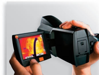
Удобный, откидной, поворотный дисплей

Путем ручного ввода параметров окружающей среды - температуры и влажности воздуха, а также поверхностной температуры - тепловизор рассчитает значение влажности для каждой точки измерения и визуализирует полученные данные посредством термограммы.