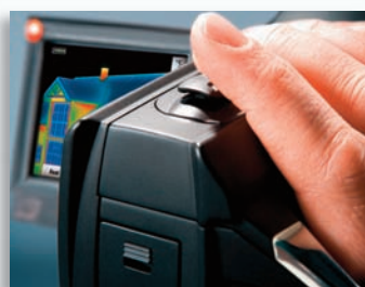
Моторизированный фокус для управления одной рукой